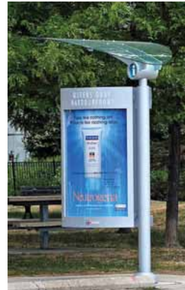
Toronto Street Column

Demandez une soumission pour l'impression de vos affiches. Notre département de production vous offre un service d'impression à un prix très concurrentiel.