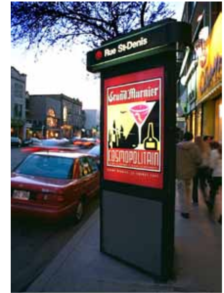
Montréal Street Column