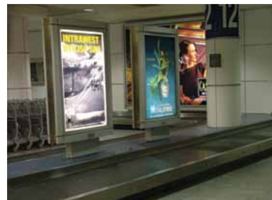
Colonne sur carousel